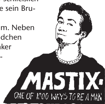
Zeichnung: Miro Sonnenscheyn

Ein schrilles Kreischen holt Sandro zurück in den Raum. Neben ihm stampft ein Wesen in Federboa und Spitzenkleidchen auf den Plateau-High-Heels rum und kann seine Klunker nicht finden. Sandro muss lange hinstarren, ehe er Michaela erkennt, die sonst immer so unauffällig und still wirkt. Michaela hat sich entschlossen, die Queen in sich zu entdecken, weil sie auf ihren King gerade keinen Bock hat und jetzt gefälligst Norma-Jean genannt werden will, bitte schön!