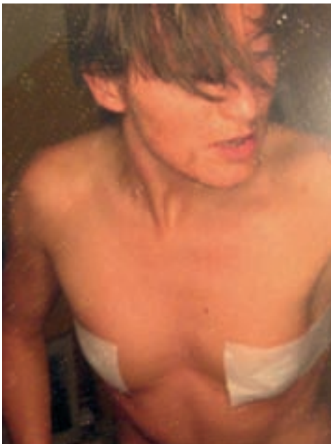
Océan.